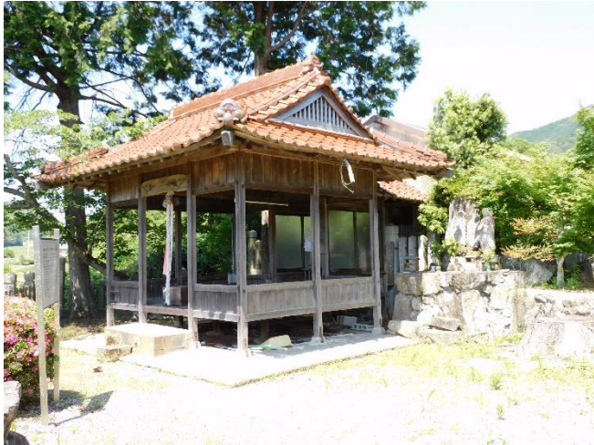
明楽寺町 きつね塚古墳

きつね塚古墳は、7世紀末～8世紀初頭、丘陵斜面に築かれた直径11m、高さ2.5mほどの円墳です。輝根塚教苑の境内にあり、横穴式石室内に流紋岩質凝灰岩製の組合式家形石棺が収められています。石棺内から2体の人骨と副葬品が発見されており、兵庫県指定文化財になっていますが、石室内部は残念ながら見学不可です。（西脇市観光協会ホームページ等参照）